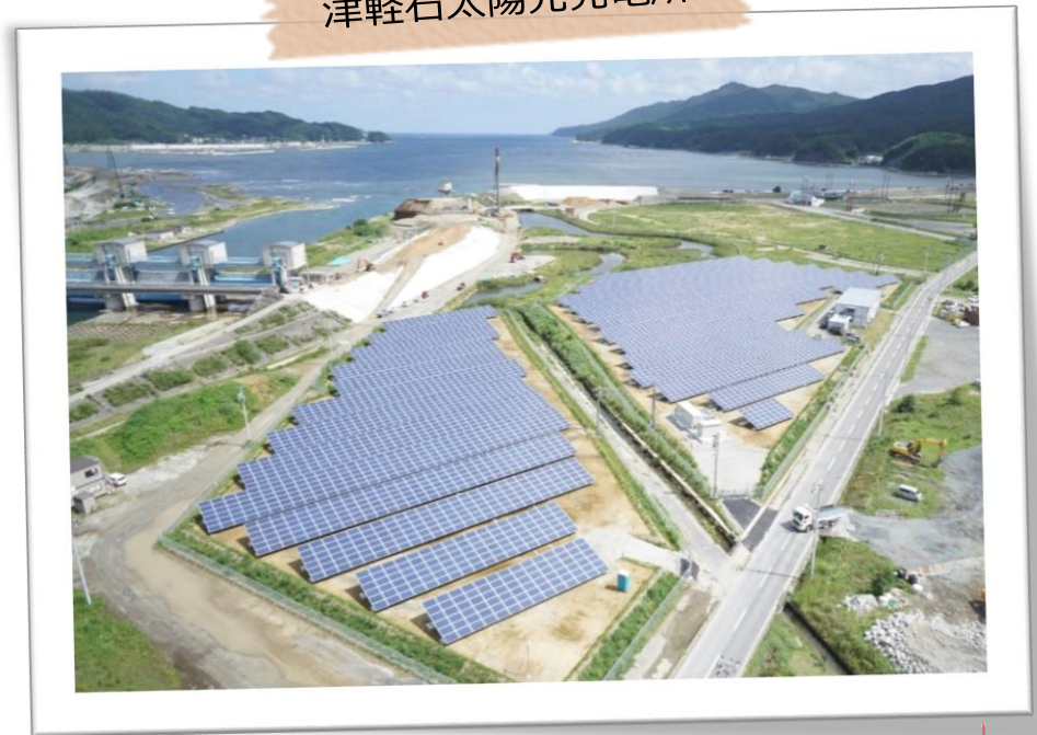
津軽石太陽光発電所