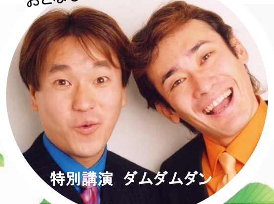
特別講演 ダムダムダン

正統派漫才師として、数々の大物漫才コンビとも共演、その実力は高く評価されています。また現在の深刻な「環境問題」や「地球温暖化」などをテーマに、「笑い」も絡めた漫才ステージ、講演なども多数こなし、その分野では「第一人者」とも言われています。政府広報番組をはじめ、各省庁のイベントにも多数出演しています。